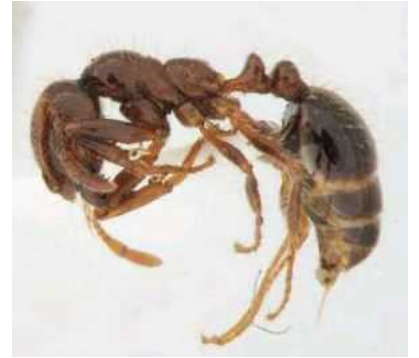
神戸市ポートアイランドで発見されたヒアリ