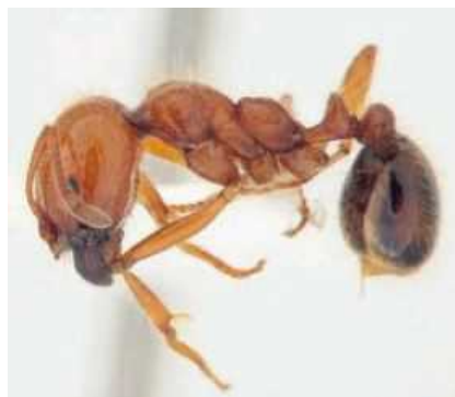
大阪府南港で発見されたアカカミアリ